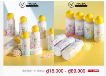
Hạt lưu hương xả vải giúp đánh tan vết bẩn và cho quần áo mùi thơm cực dễ chịu, lưu hương suốt cả ngày!

- Ủ, tất nhiên rồi. Để tao điều động anh em chiều này mình làm một tặng. À mà không được, chiều nay tao phải giao hàng cho bên đối tác làm ăn. Hay là chiều mai nhe.