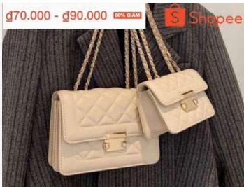
Túi xách đeo chéo 2 ngăn cực xinh, giá sốc không thể tin cho dịp cuối năm!