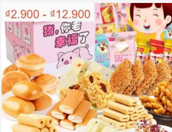
Combo đồ ăn vặt tổng hợp, thử là mê, món nào cũng mới lạ - Sale sập trên Shopee chỉ từ 3K - 12K

Tôi chào nó và cúp máy. Sau đó tôi quay về nhà của đi.