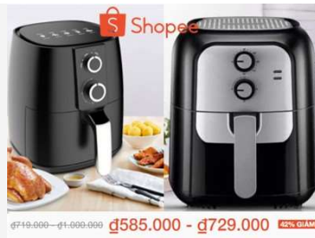
Top sản phẩm Shopee bán chạy: Nồi chiên không dầu siêu đỉnh, mẫu mã đẹp - Giảm đến 40%