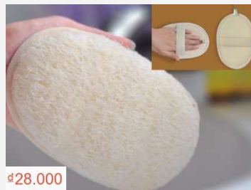
Bông tắm và rửa mặt bằng xơ mướp giúp massage da và loại bỏ tế bào chết - Chỉ 28K trên Shopee!