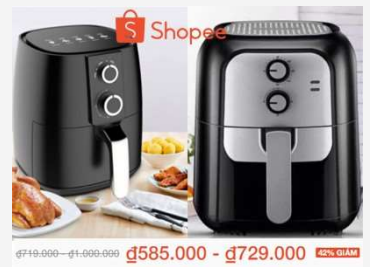
Top sản phẩm Shopee bán chạy: Nồi chiên không dầu siêu đỉnh, mẫu mã đẹp - Giảm đến 40%

- Anh đi đâu đó? Xấu nhe, đi chơi một mình. – Vừa bước vào nhà thì con Ly chạy lại hỏi.