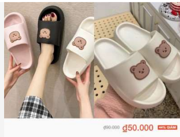
Đép nữ gấu để bánh mì 3 màu siêu xinh, đảm bảo mềm chân để đi với mức giá không thể rẻ hơn