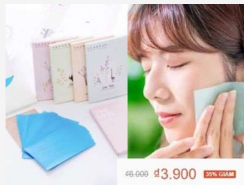
Giấy thấm dầu RẺ NHẤT SHOPEE - Vật bất ly thân cho các cô nàng trong mùa hè để có 1 làn da không bóng nhờn!